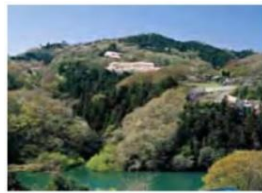
名倉の「芸術の道」の屋外アート