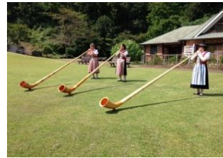
手作りアルプホルン