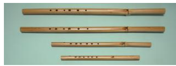
竹笛・横笛・バンブーフルート