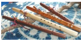
インディアンフルート

木製楽器は古くから作られてきましたが、ケーナ・フルート・アルプスホルンなどを手作りして楽しむこともできます。