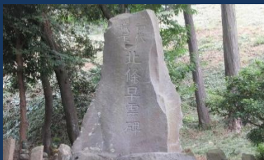
興国寺城の北条早雲碑