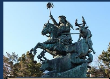
小田原駅前 の 北条早雲像