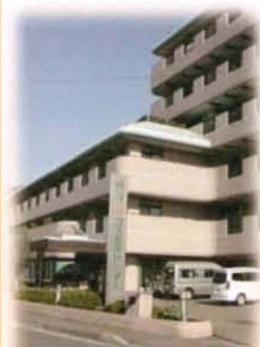
コスモスセンター (特養・ケアハウス・居宅・地域包括)