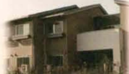
グループホーム秋桜&認知デイ秋桜