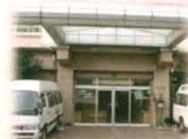
相模原市立 星が丘デイサービスセンター 星が丘高齢者支援センター (地域包括支援センター)