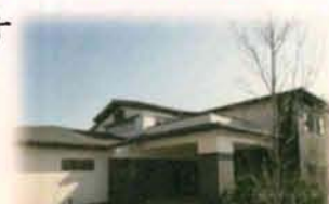
ずっと我が家 上溝本町 (ショートステイ・デイ・ヘルパー)

〒252-0243 相模原市中央区上溝 5423 番地 5 TEL 042-768-1801 FAX 042-768-1665