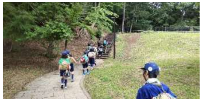
自然観察のために自転車を置いて移動します。