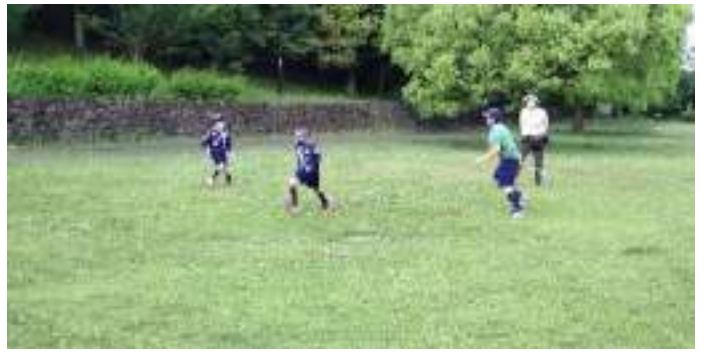
食後の運動？しっぽ取りゲームをしました。