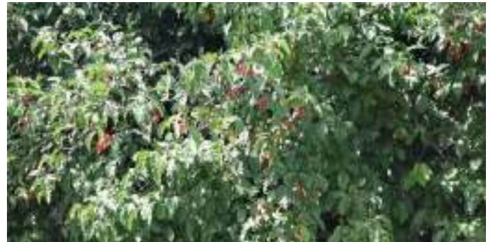
グミのみがたくさんなっていましたよ