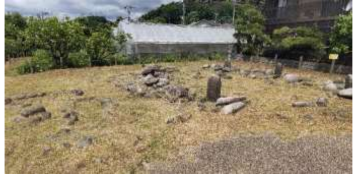
レプリカですが、こんなところにあっただすね！