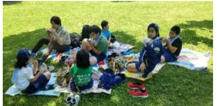
昼食にします。いただきます！