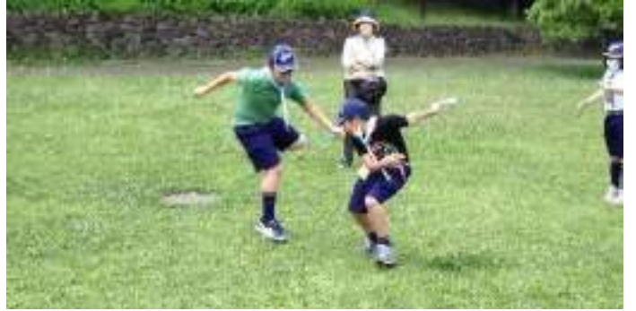
みんな食後なのによく走れるねー