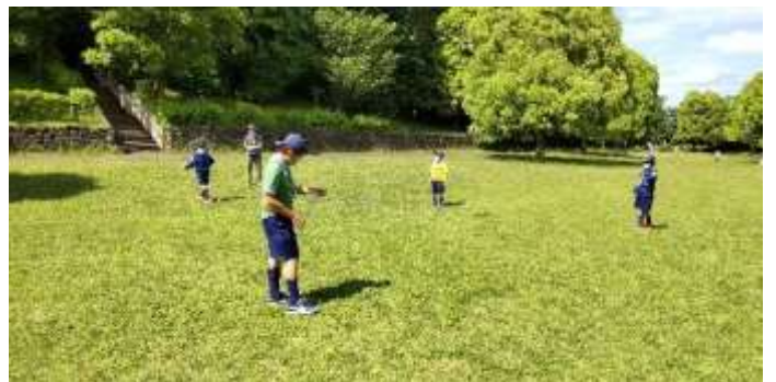
そろそろ帰りますよ～