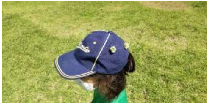
シロツメクサで帽子に飾り！