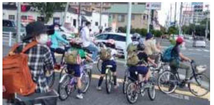
帰りの途中、信号待ちです。