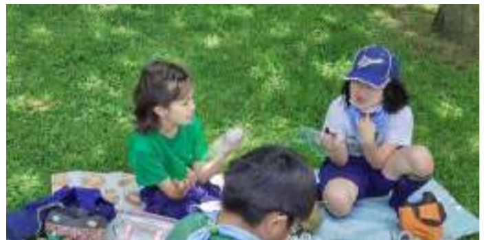
晴天のもと、おにぎりおいしいそうです。