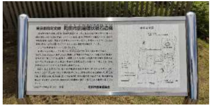
田端遺跡で休憩と観察をします。