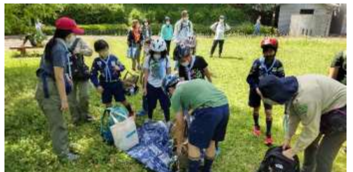
ご飯も食べたので、移動します。