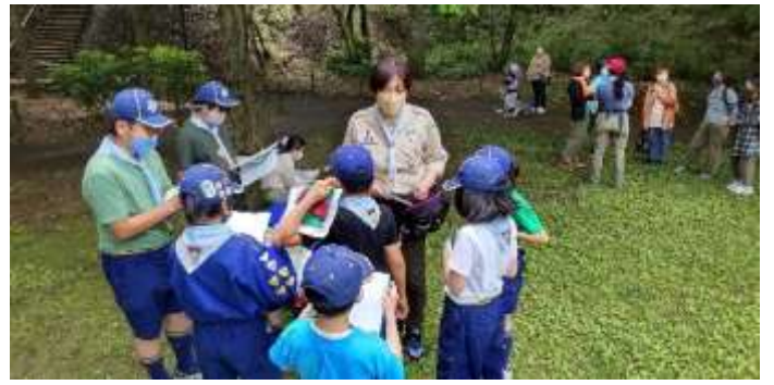
ビジターセンター前で自然観察です。見つけられるかな