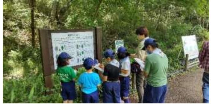
自然観察もみんなできたかな？