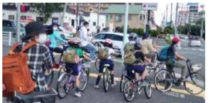
帰りの途中、信号待ちです。