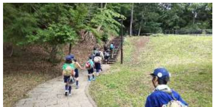
自然観察のために自転車を置いて移動します。