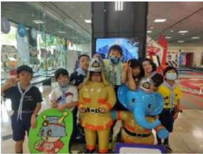
体験までのもう少し時間があつたので、今度はみんなで記念撮影！