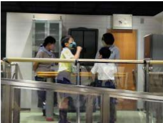
さて、体験の最初は地震体験。しっかりつかまってね