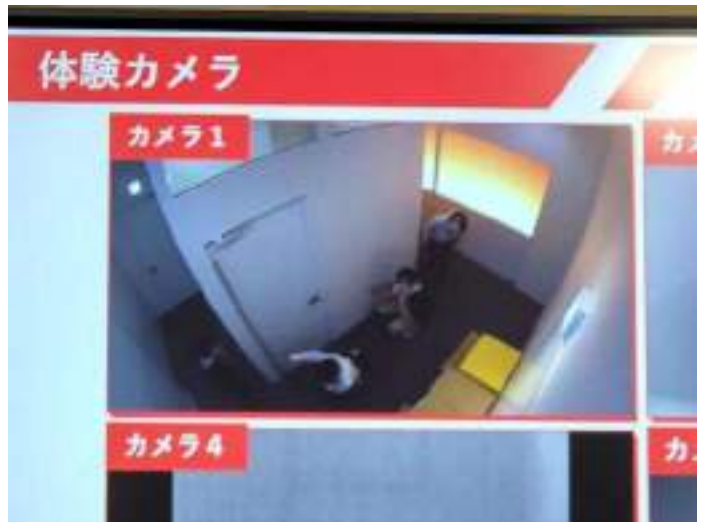
2つ目は煙体験。煙の中を姿勢を低く、進んでいきます。