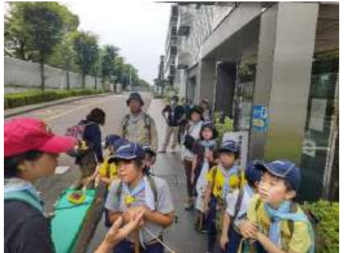
さて、立川防災館へ到着です。スカウトも頑張って歩きました。