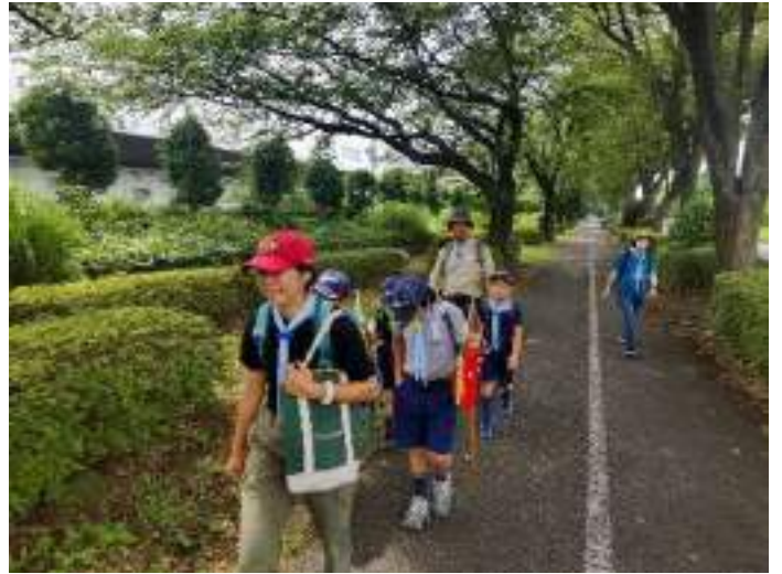
日陰で休憩したり、木陰の歩道を選んで進みました。