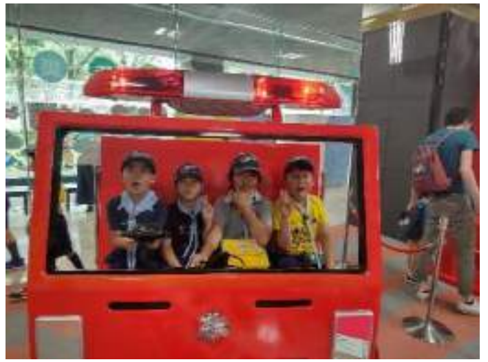
体験の時間まで時間があるので自由行動。さっそく記念撮影！