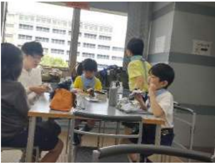
午前中の自由行動後、昼食タイム