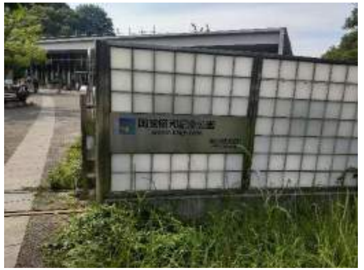
目的地の立川防災館まで道のり 30 分、昭和記念公園を横切りプチハイクです。