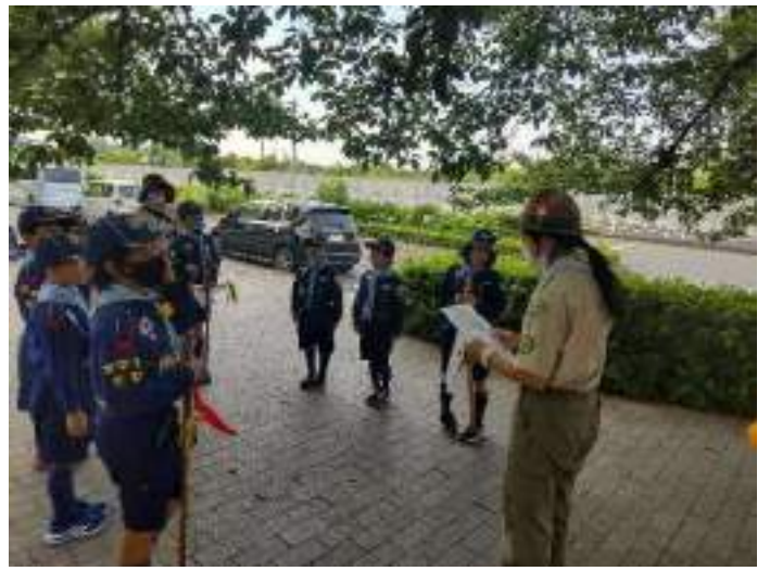
規律、協力、ゲームなど各種表彰！