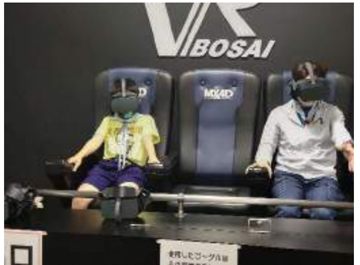
最後は火事のVR体験。迫力がありましたよ。