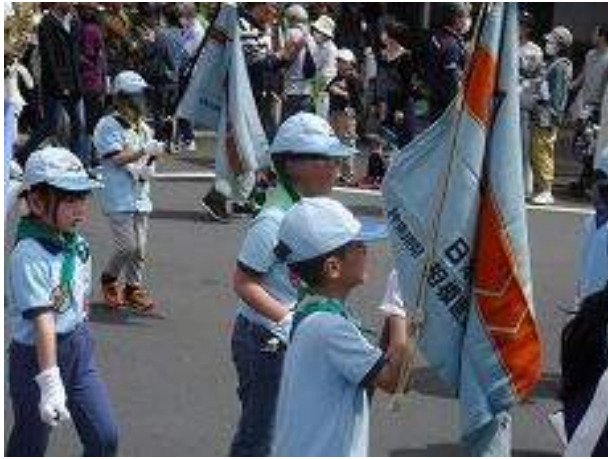
みんなぶじにパレードをすることができました。よくがんばったね。