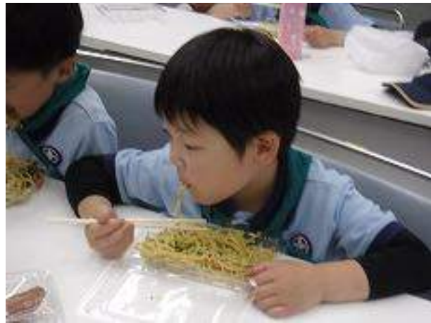
おひるごはんはおとうさんおかあさんたちがやたいでつくってくれているとくせいやきそばとフランクフルトです。