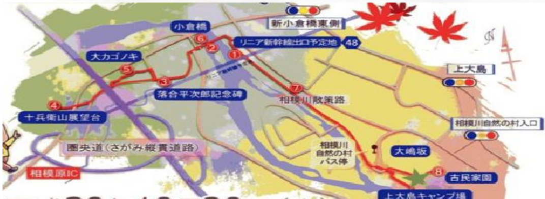
秋の相模川ガイドツアー 平成30年10月20日