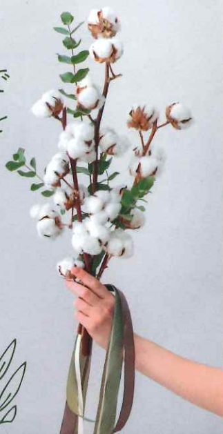
cotton cap sample