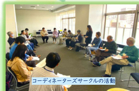
コーディネーターズサークルの活動